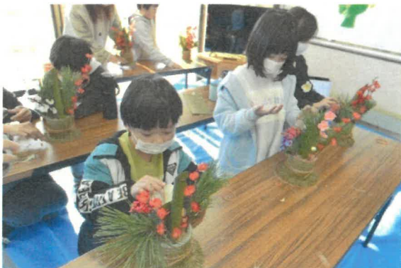
もうちょっとで完成だ