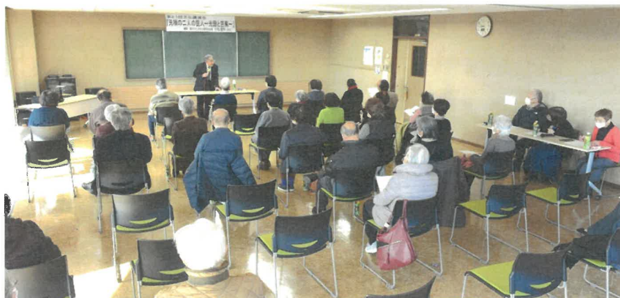
(今年の講座の様子)