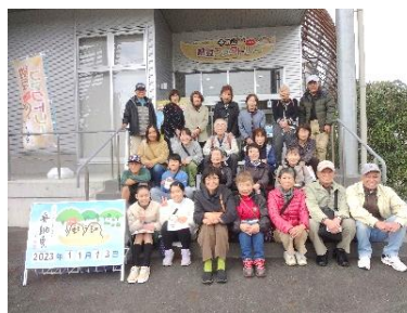
納豆工場での見学を終えて記念撮影

ったばかりの大豆を試食。あまりのおいしさに皆感動。見学後は道の駅奥久慈だいで昼食。そしてバスは大子町小生瀬の豊田りんご園へ。この時期のメインはサンふじだそうで園内では、スタッフの説明を聞きながら、慎重に品定めをしていました。