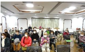
映画を鑑賞した皆さん

の中に、老後の生活問題や特殊詐欺など色々考えさせられる内容が盛り込まれた映画でした。