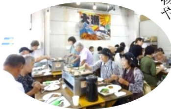
海鮮バーベキューに舌鼓(いわき・ら・ら・ミュウで)