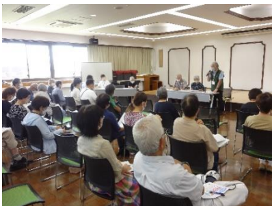
第2回キーパーソン会議(大会議室で)

新しい手引に作り替えた緊急連絡カードは関係者の手元に届けてありますが、もし古いカードがございましたら、電話53-9530水木学区社協までご連絡をお願いいたします。